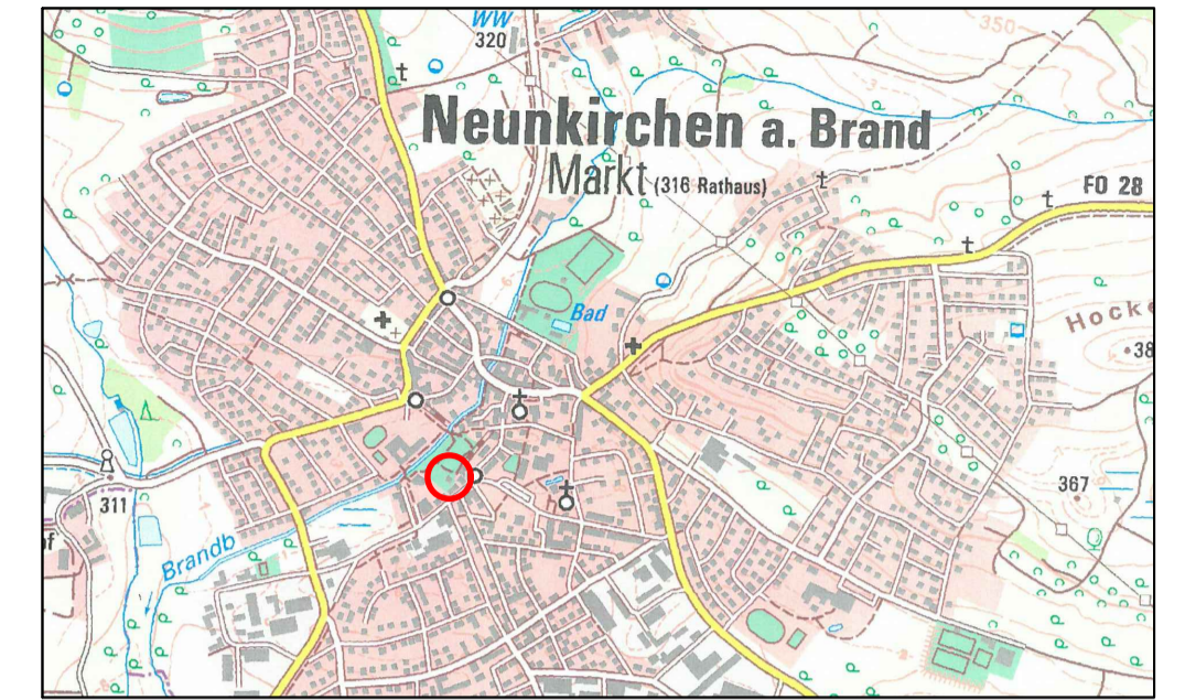
Übersichtslageplan (genordet, ohne Maßstab)

Umgrenzung von Erhaltungsbereichen, § 172 Abs. 1 BauGB